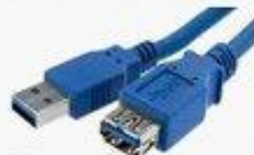
TV avec lecteur Média USB