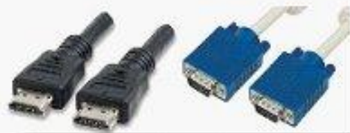
Connection HDMI VGA